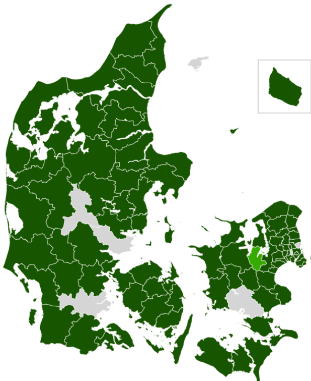
Danmarkskort ibrugtagning Aftaleoversigt Link